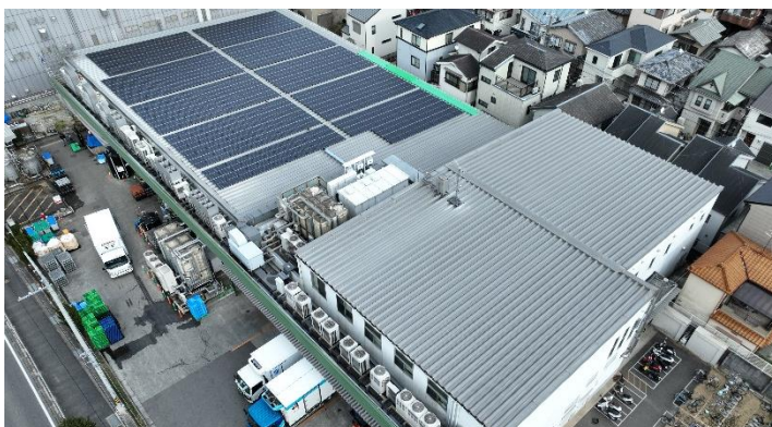
※ピクルスコーポレーション関西 本社・京都工場 太陽光パネル