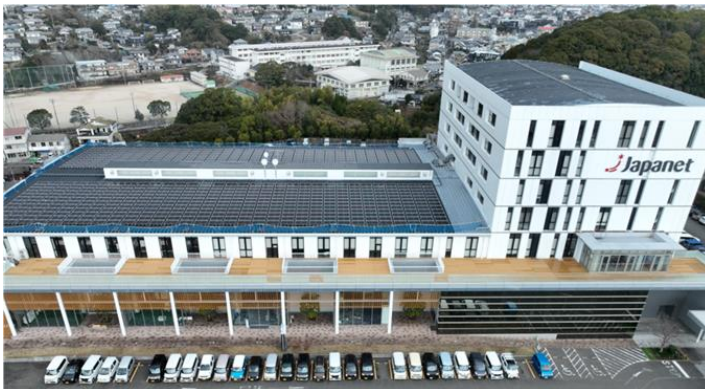
※ジャパネットたかた 本社 太陽光パネル