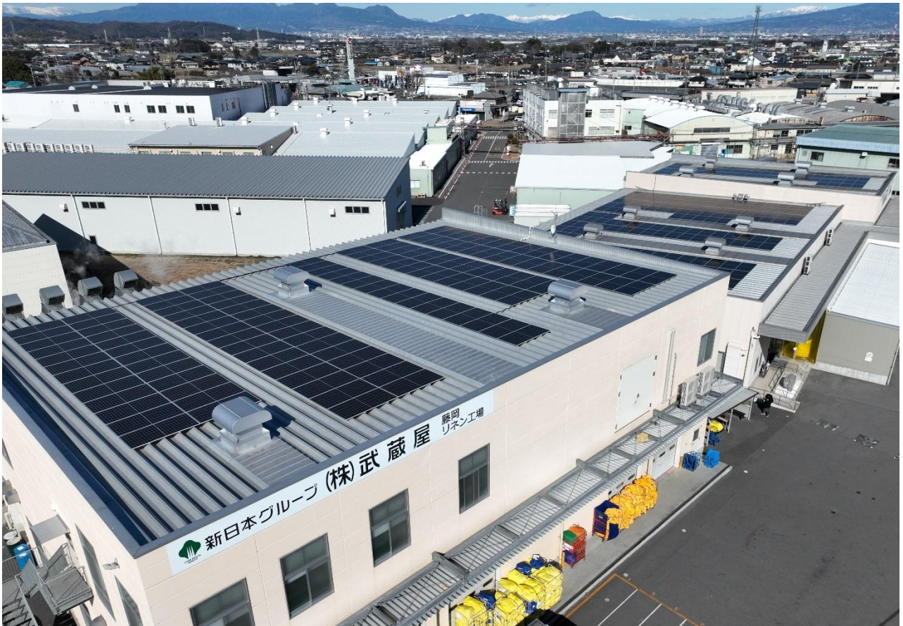
※武蔵屋藤岡工場、屋根上太陽光パネル