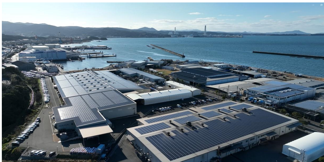
※住商エアバッグ・システムズ株式会社 第 1・2 工場、第 3 工場、屋根上太陽光パネル

導入場所：住商エアバッグ・システムズ株式会社 第 1・2 工場、第 3 工場、所在地：長崎県松浦市調川町下免