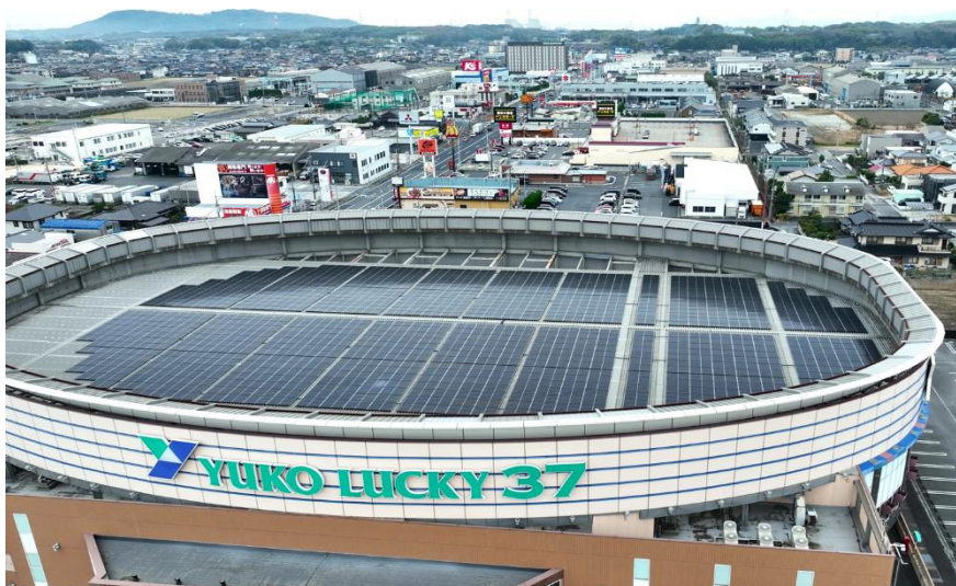
※ユーコーラッキー37 宇部店屋根上太陽光パネル

導入場所：ユーコーラッキー37 宇部店、所在地：山口県宇部市大字妻崎開作 849