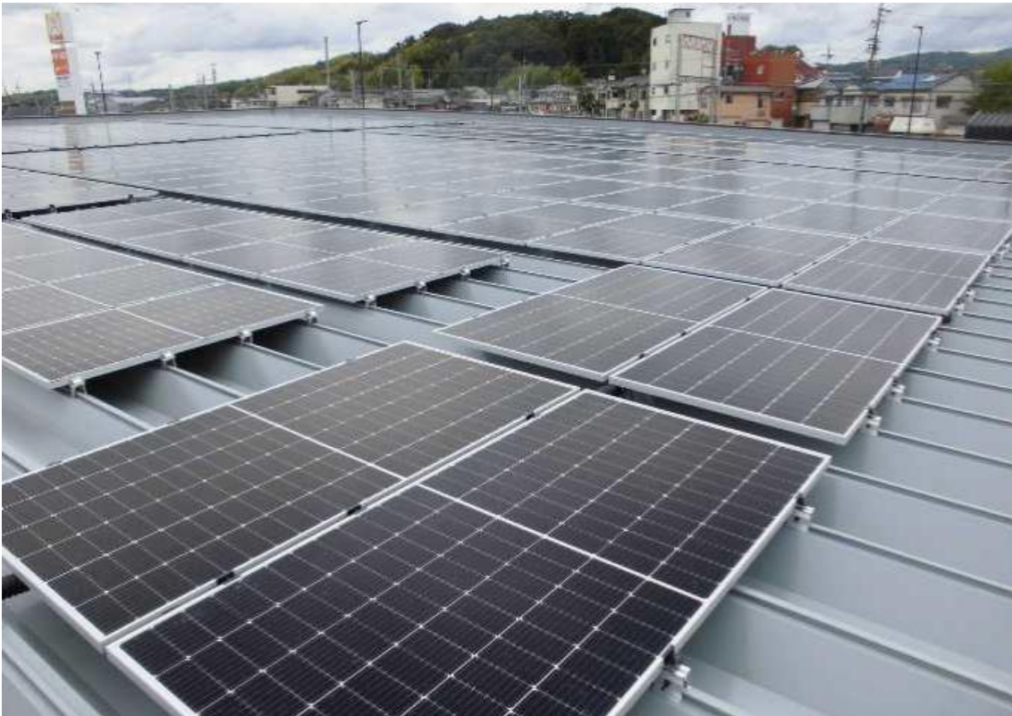
※サンフレッシュ狛田店、屋根上太陽光パネル