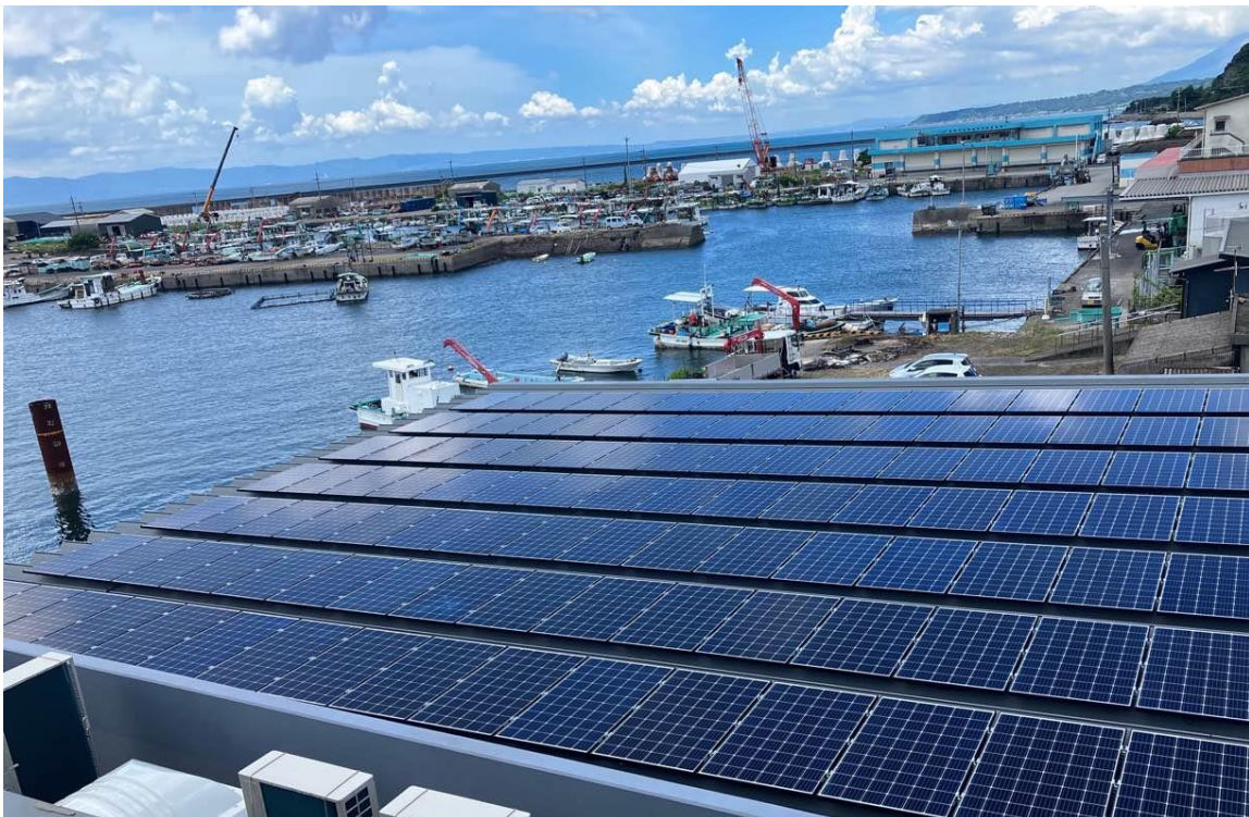
※鹿屋市漁協 加工場、屋根上太陽光パネル