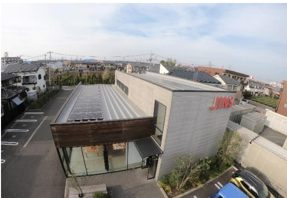
■ JINS 青梅店