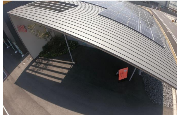
■ JINS 水戸元吉田店