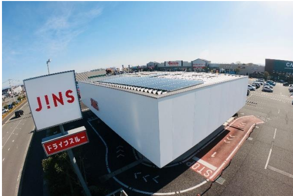
■ JINS パワーモール前橋みなみ店