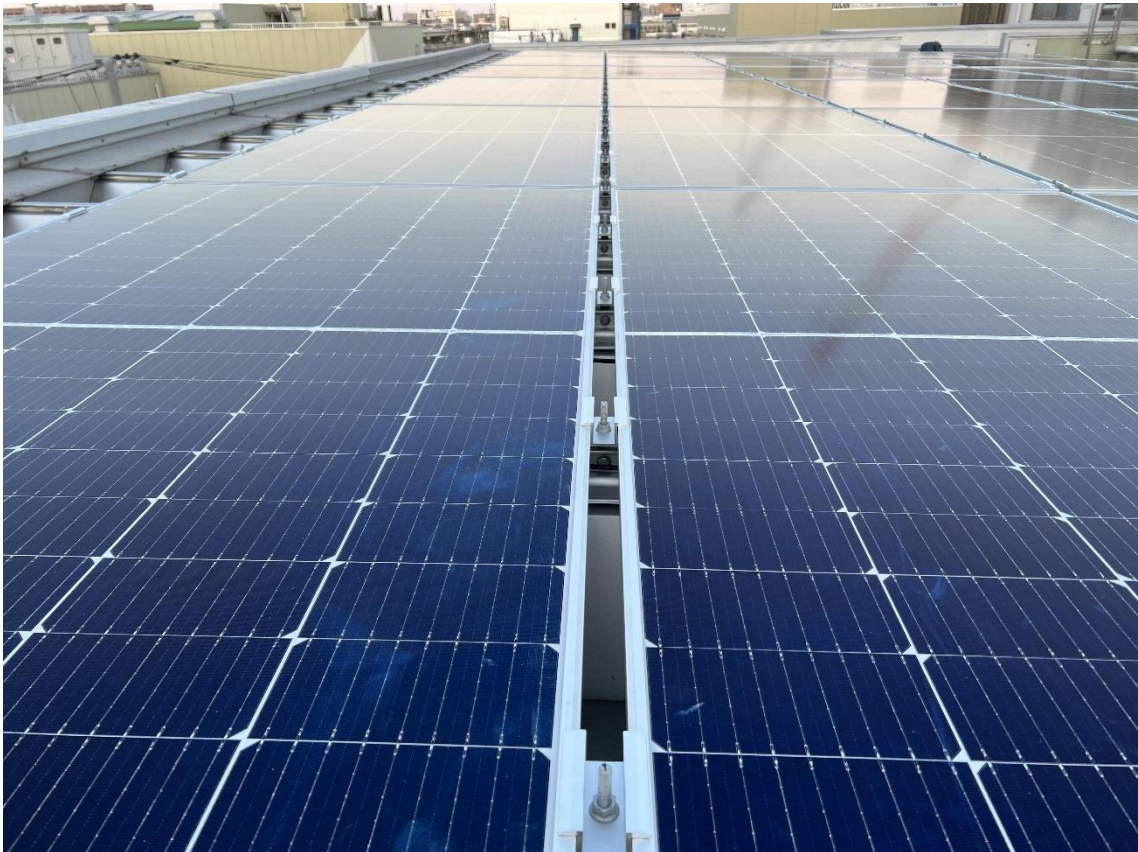
※城北工業 本社工場、屋根上太陽光パネル