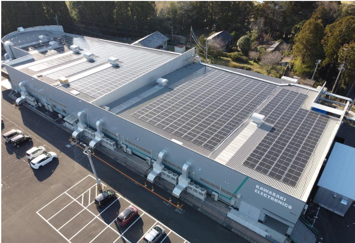
※川崎電子 都城南部工場、屋根上太陽光パネル